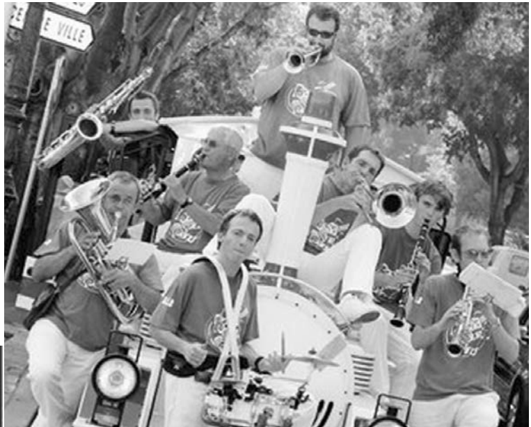
Le Bastia Blue Band que l'on ne présente plus dans les rues de Bastia