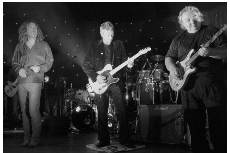
L'ancien guitariste de WHITESNAKE, BERNIE MARSDEN rend hommage à son pote irlandais, Rory Gallagher