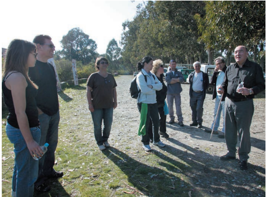
Le président Joseph Castelli s'est réjoui de l'implication du public

Si elle s'inscrit dans le cadre d'une opération qui se veut exemplaire et destinée à sensibiliser le grand public à l'exigence de propreté, cette action démontre également que le littoral, à l'aube d'une sai-