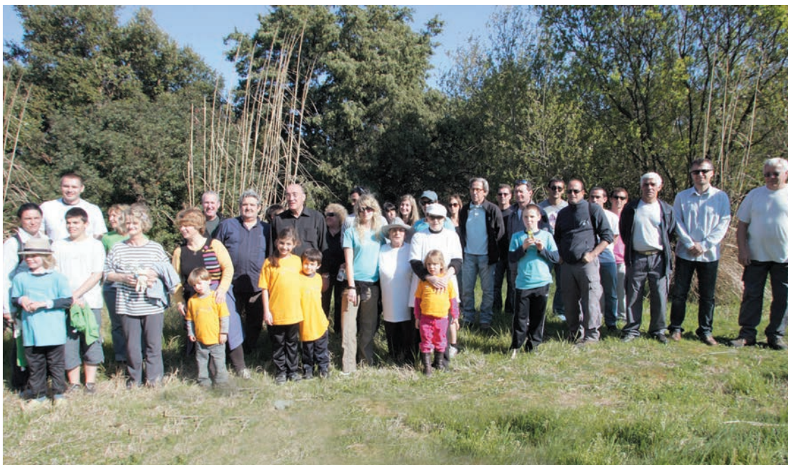
La journée a réuni petits et grands

tion est en ce sens un véritable investissement sur l'avenir, car les déchets côtiers ne sont pas simplement recyclés, mais c'est le paysage même, support aux activités de l'homme, qui est ainsi régénéré et préparé pour les générations futures d'usagers. Enfin cette action démontre que l'on peut autour d'une cause réunir élus, agents publics dont c'est la mission et grand public dans un cadre productif où le lien social est omniprésent autour de l'idée de protection de la nature. Les enfants avaient répondu présents et leur geste souligne la portée éducative que sous-entend la démarche de développement durable.